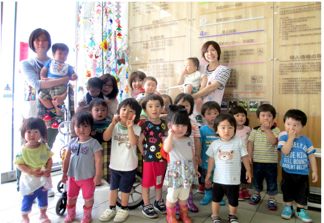
あさひ保育園の園児たちと手作りの七夕飾り(市民病院 玄関)