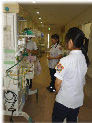
昨年度の「高校生 1 日看護体験」の一場面