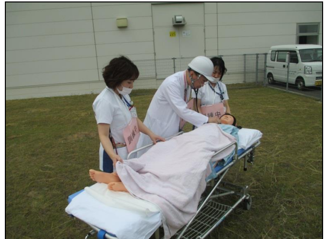
ヘリポートからドクターヘリで負傷者を搬送