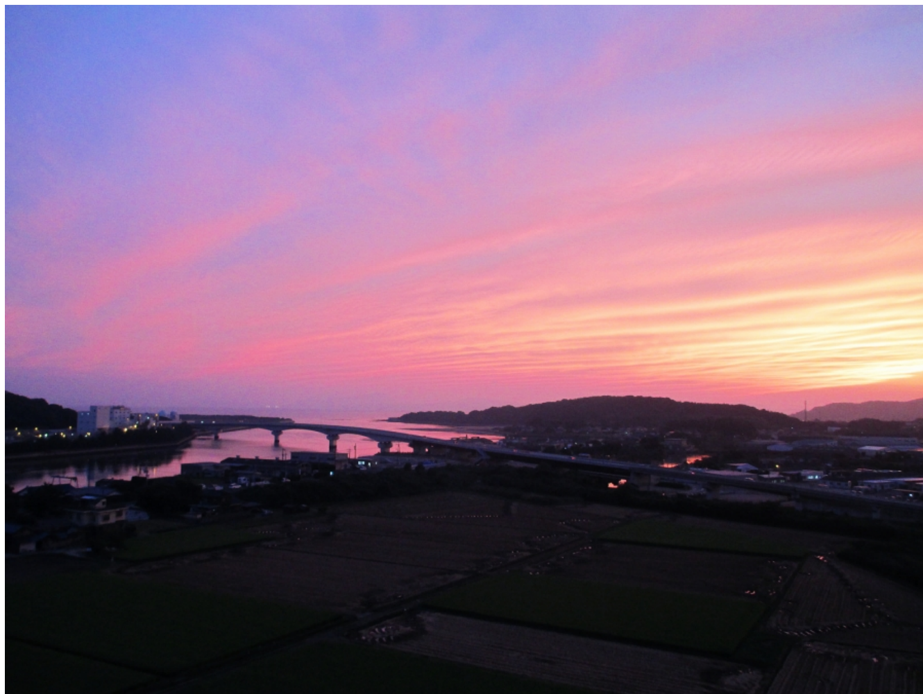
市民病院の屋上からの夕日