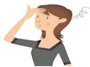
ボディー チェッカー