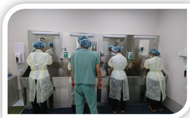
手術前の手洗い体験（昨年の様子）