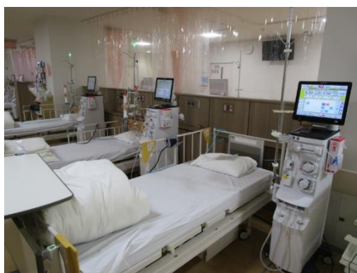
腎・透析センター

透析液製造室の30床対応可能な水処理装置、透析製剤溶解装置と多人数用の供給装置です。いずれもクリーンな透析液を製造・供給できるオンラインHDF対応の仕様となっています。