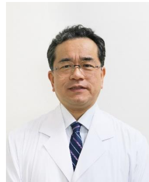
脈管専門医 下肢静脈瘤血管内焼却術実施医