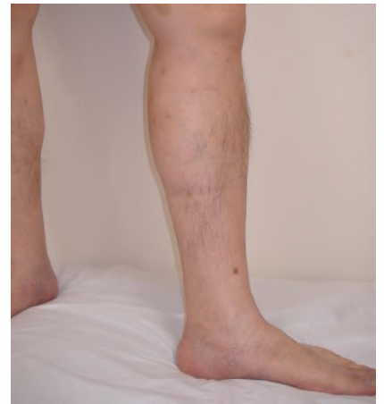
高周波焼却術 2 年後

2011年までは次に述べる大伏在静脈除去術が標準的な治療法でしたが、2011年1月より980nm半導体レーザーによる血管内焼灼術が保険適応となりました。しかし、この治療では手術後の痛みや皮下出血が問題となっていました。これらの合併症を改善した14700nm半導体レーザーと高周波（ラジオ波）による2種類の機器による血管内焼灼術が2014年6月に認可されました。当院では2015年10月より高周波による血管内焼灼術を開始し、これまで97名の患者さんに治療を行い良好な結果を得ています。この治療により手術に伴う傷が随分小さくなりました。